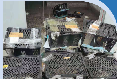
苏州中通中转站的“宠物盲盒”快递