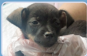
被解救出的小狗正在接受治疗