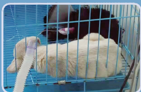
幸存的小狗情况不容乐观

目前,苏州市邮政管理局正在对案件情况进行详细调查,后续将尽快根据调查情况依法处理并通报结果。苏州市邮政管理局提醒,按照《中华人民共和国邮政法实施细则》,“各种活的动物”禁止寄递,同时明确,“符合邮电部特准交寄规定并确保安全的,可以收寄”。但是,寄递符合相关规定的活体动物,一定要提供检疫证明,并保障活体动物的生命安全,不对社会造成危害。同时,呼吁广大消费者和电商平台,对违背社会公序良俗的消费行为予以坚决抵制。