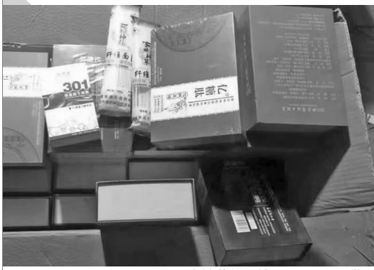
冒充神药的保健品