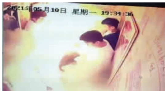
成都一小区,一辆电动车在电梯内起火 视频截图