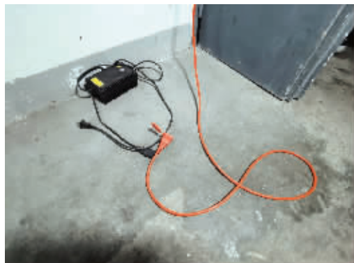
不少居民家门口停着电动车,有的放着电动车充电器

5月10日晚,四川成都一小区内,一男子推电动车进入电梯后,电动车突然起火进而爆燃,事故造成电梯内5人不同程度烧伤,其中包括一名婴儿。事故现场视频在网上发布后,引发广泛关注。