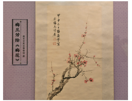
梅兰芳创作的《梅花》