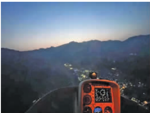
救援队出动直升机搜索金钱豹