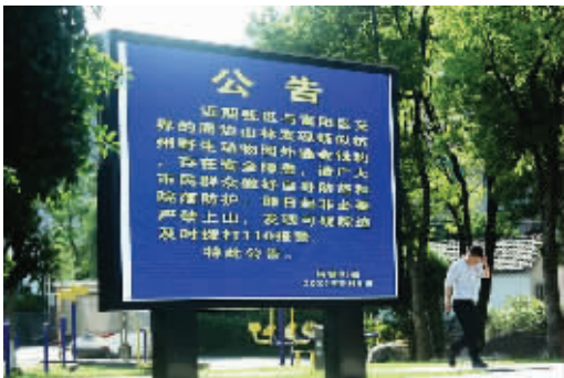
有关出逃金钱豹的公告