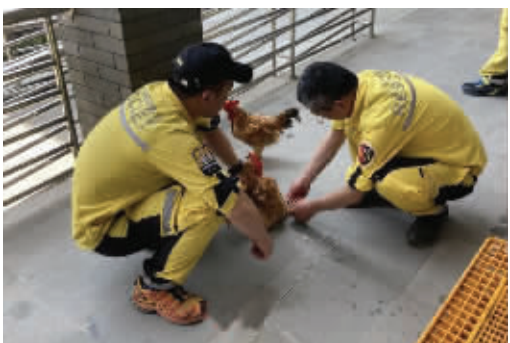
搜救队带鸡上山