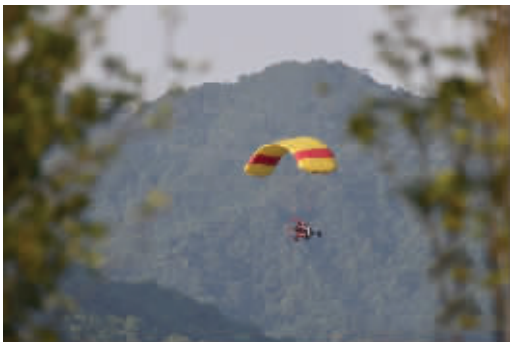
工作人员乘坐动力伞在山林上空搜寻金钱豹