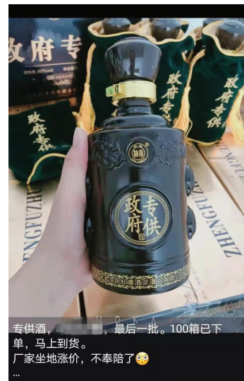
张家港执法部门查获的“政府专供”酒

快报讯(记者 高达)“特供”“专供”这些字眼看上去就自带光环,有了它们的加持,仿佛商品就成了精品,买了它就成了人生赢家。近日,张家港市市场监督管理局接到市民的举报,称有人通过微信朋友圈售卖政府专供酒,图片中的白酒既无产品标签,也没有任何包装,瓶身只见大大的“政府专供”字样,怀疑该酒的来源、质量都可能有问题。