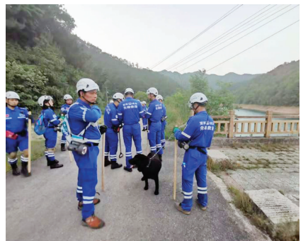
搜寻队员准备进山