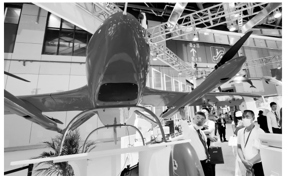
5月7日,工作人员(左)向参观者介绍一款长航时垂直起降固定翼无人机展品。

5吨级地效飞机AG930,新舟灭火飞机和翼龙-2H应急救援型、气象型无人机……在5月7日举办的首届长三角国际应急救援博览会,多款国产应急救援新装备首次亮相,展示了国产应急救援装备体系化发展的最新成果。