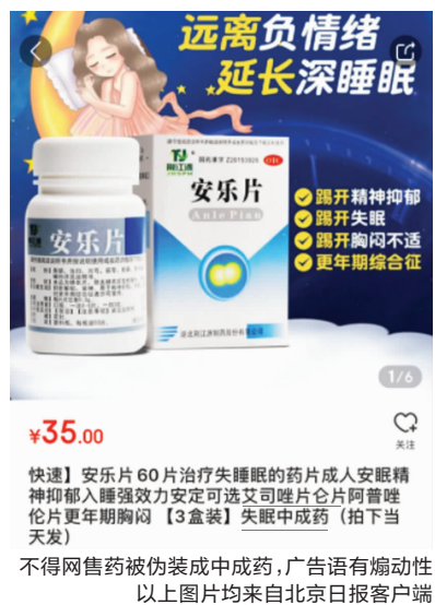
不得网售药被伪装成中成药,广告语有煽动性

意见明确指出,严禁销售国家实行特殊管理的药品。根据规定,疫苗、血液制品、麻醉药品、精神药品、医疗用毒性药品、放射性药品等药品属于特殊管理药品,不得在网上销售。