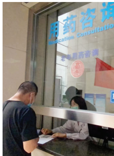
线下医疗机构可以进行用药咨询

意见明确要求,网售处方药需要有来源真实的电子处方,也就是说,应当在审核电子处方后再为患者开药,这样才合规。