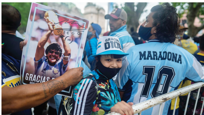
马拉多纳去世后，阿根廷民众在总统府玫瑰宫前举行悼念活动

阿根廷司法部门指派一个由20名专家组成的委员会调查马拉多纳死亡是否关联人为过失。除卢克外，另外两名私人医生、两名护