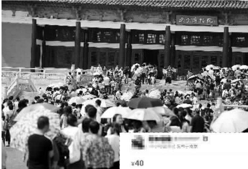
▲假日,南京博物院游客爆满