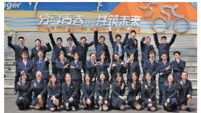
南外保送生

快报讯(通讯员 刘洪雷 记者 黄艳)29人被清华北大预录取,还有美国的哈佛大学、耶鲁大学,英国的牛津大学、剑桥大学等世界名校。这是南京外国语学校2021届毕业生的部分成绩单,还有近60名学生选择高考。这样优秀的成绩如何取得?4月28日,部分保送国内名校的南外保送生来到学校,分享了他们的成长感悟。校方也“剧透”了今年的特长生招生变化。