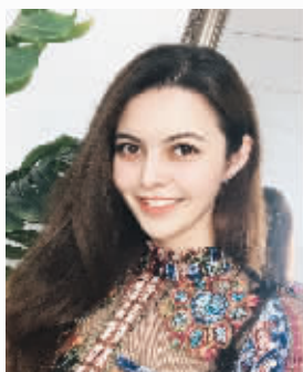
生活中的迪丽胡玛尔