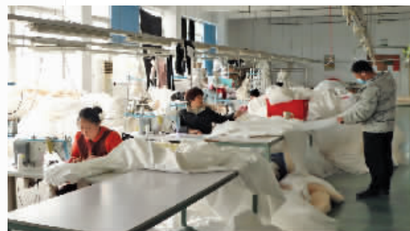
迪丽胡玛尔工厂的员工正赶制婚纱