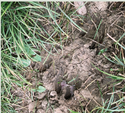
八字山公园草丛里的脚印