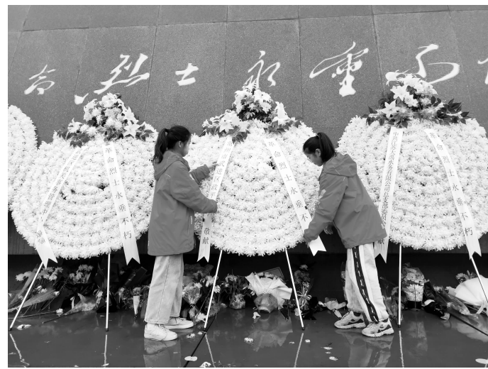
祭扫武进烈士陵园

为缅怀先烈功绩，继承革命遗志，4月1日，政平小学组织学校大队委员、各班优秀少先队员代表、部分小记者代表，赴武进烈士陵园进行祭扫活动。