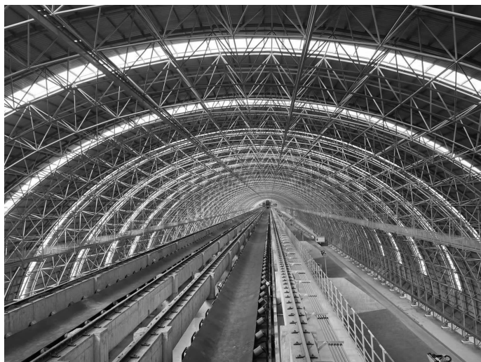
已完成施工的2号料场

据悉,此次举办专题企业开放日宣传活动的沙钢6号料场棚化项目,是沙钢集团为环境治理,减少无组织排放,将露天原料堆场全面棚化封闭的超大型环境保护工程。场地全长953米、总宽411米,占地面积34.5万平方米,相当于48个标准足球场大,封闭形式采用了三连跨组合而成,建成后将是全国最大的全封闭式料棚。该项目属于不规则形大跨度空间结构,采用了不对称的预应力管桁架空间结构的设计方案,属于创新型设计方案;围护结构采用目前较流行且环