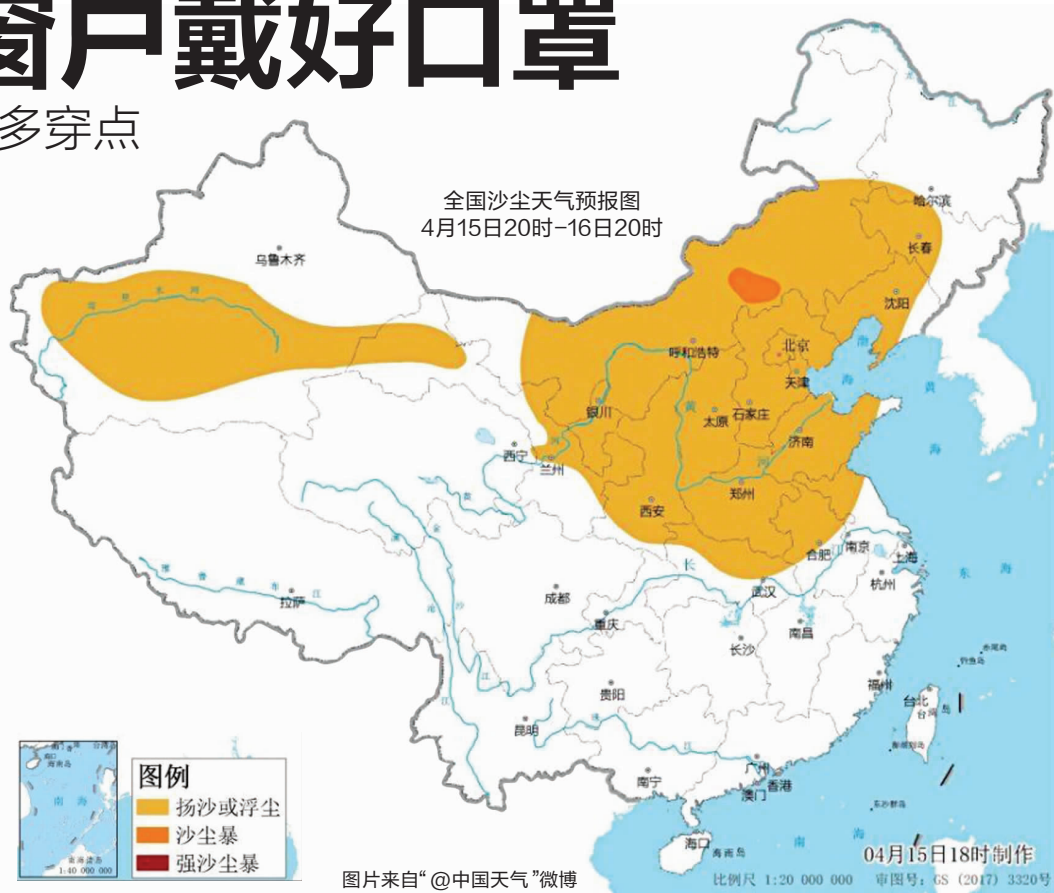
全国沙尘天气预报图 4月15日20时-16日20时