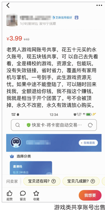
游戏类共享账号出售