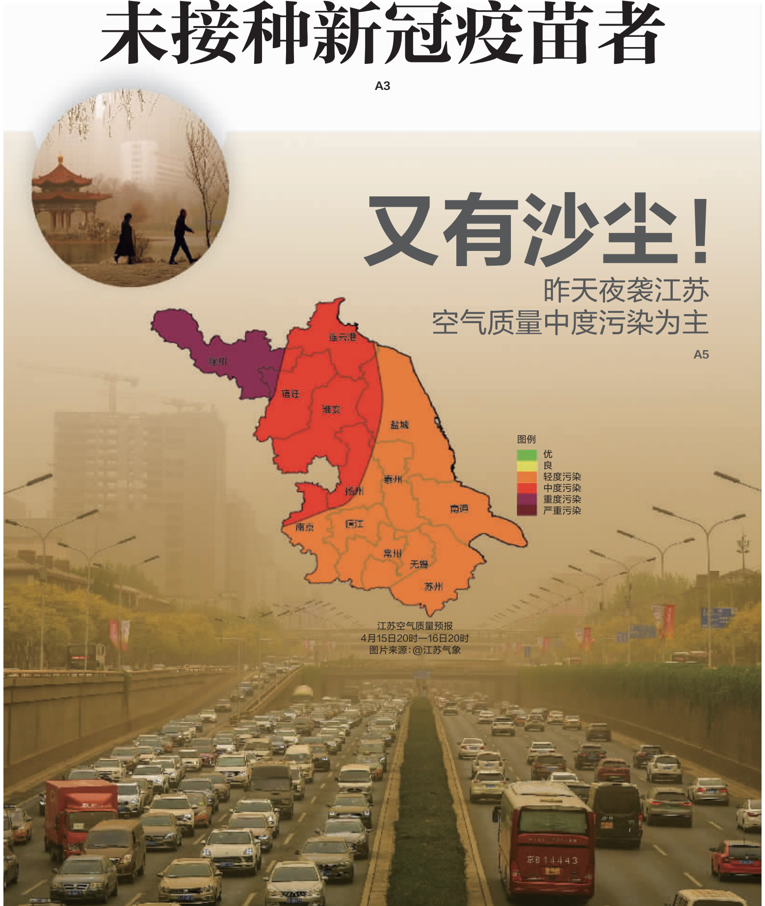
4月15日,北京出现沙尘天气(大图);4月15日,呼和浩特遭沙尘侵袭,天空昏黄(小图)