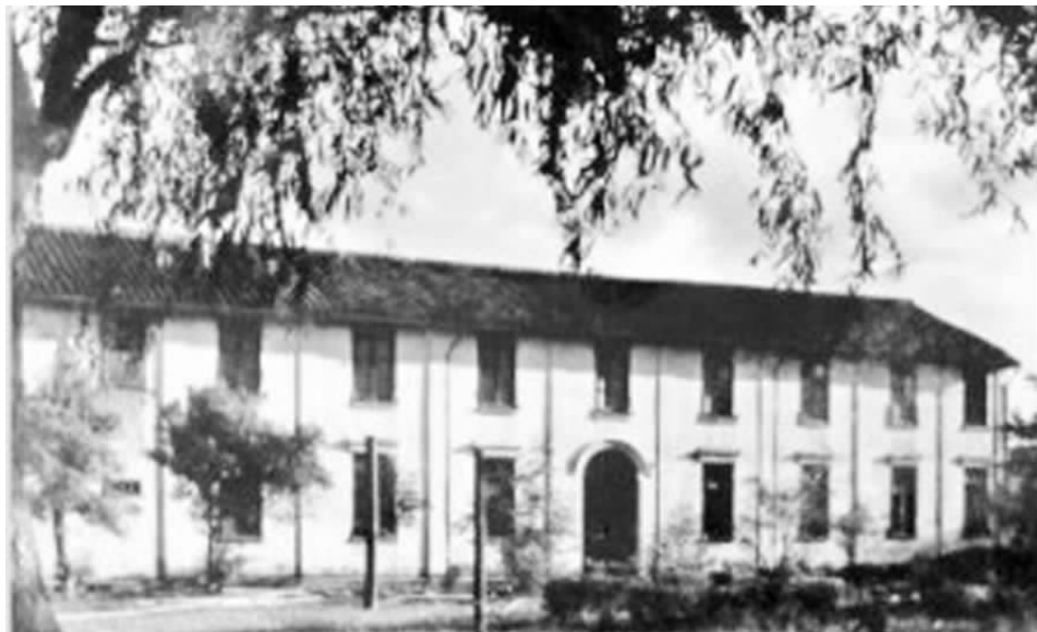
乐益女中校舍旧照