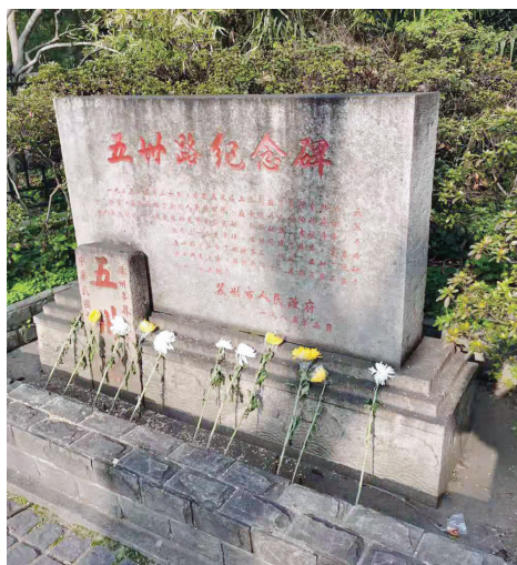
五卅路纪念碑前摆放着市民游客自发献上的菊花