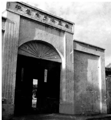
乐益女中大门旧照