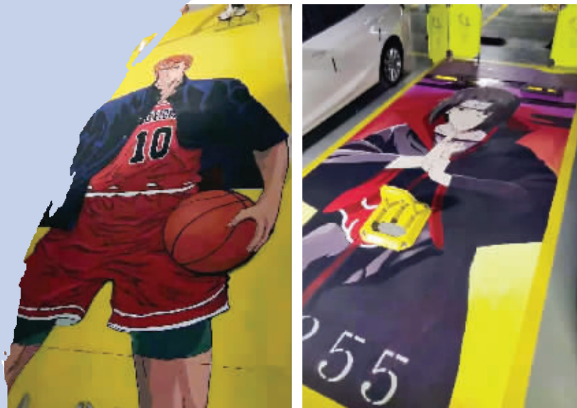
两款彩绘停车位