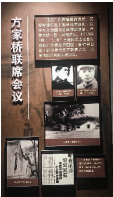
太仓革命历史陈列馆里有关方家桥联席会议的介绍