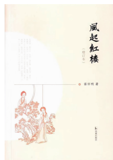
《风起红楼》 苗怀明 著 凤凰出版社

“其中有不少内容,就是怼‘民科’的。我原来的设想,大家彼此相安无事,你研究你的,我研究我的。但是我发现有的‘民科’进攻性特别强,他一旦提出个观点,说是跟你交流,但其实是强迫你接受,非常霸道。说服不了人家就贬低人家,说专家学者水平低、人品差,至匿名写文章躲在阴暗角落里破口大骂,而不从自己身上找原因,这是无能的表现。”