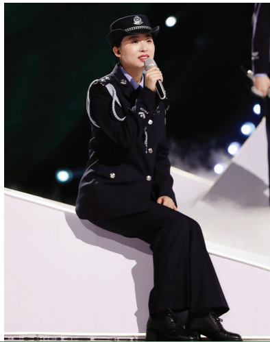
周谭在《乘风破浪的姐姐》舞台上