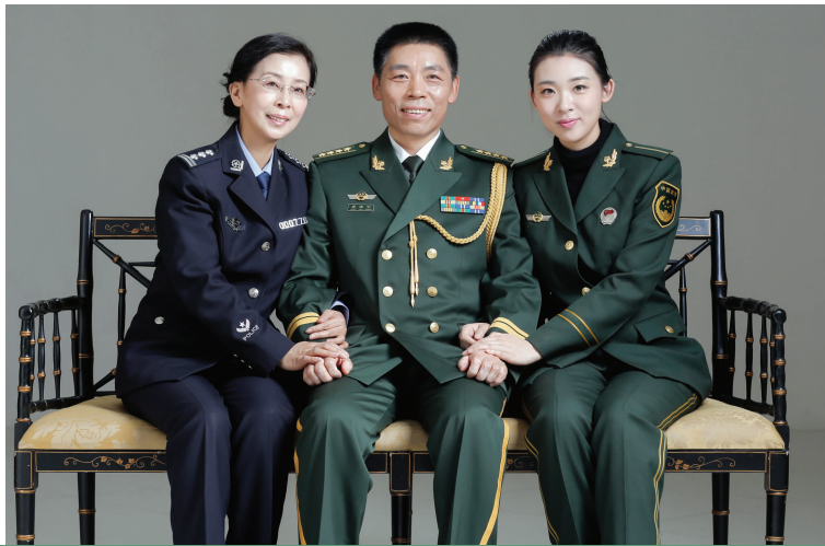
周谭与父母的合影