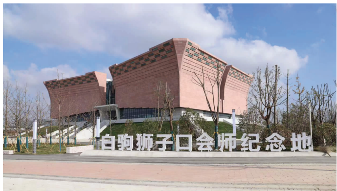
八路军新四军白驹狮子口会师纪念地(资料图片)

在会师纪念碑后面，是红砖建成的会师文化展示区，庄严肃穆令人肃然起敬。“会师文化展示区的主体建筑，从外观看，象征着南北会师的两面军旗。”解说员告诉现代快报记者，会师文化展示区以全史馆的形式分为“日本侵华，全民抗战；巩固华北，发展华中；同仇敌忾，会师白驹”等五个部分。