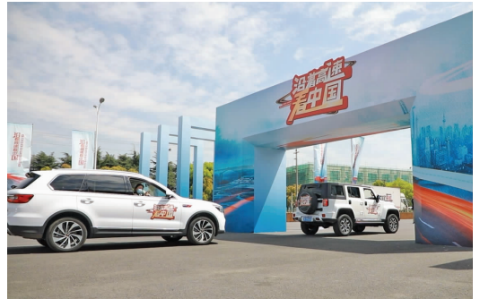
“沿着高速看中国”主题宣传活动启动