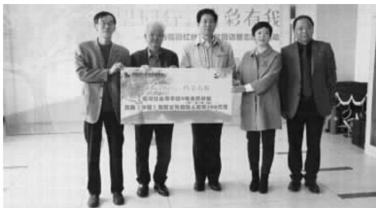
完美公司爱心捐赠300万元,支持临汾红丝带学校

从1997年在革命圣地延安捐建第一所完美希望小学起,完美公司就开始在全国捐建希望小学,从此与希望工程结下不解之缘。截至目前,完美公司向中国青少年发展基金会捐款