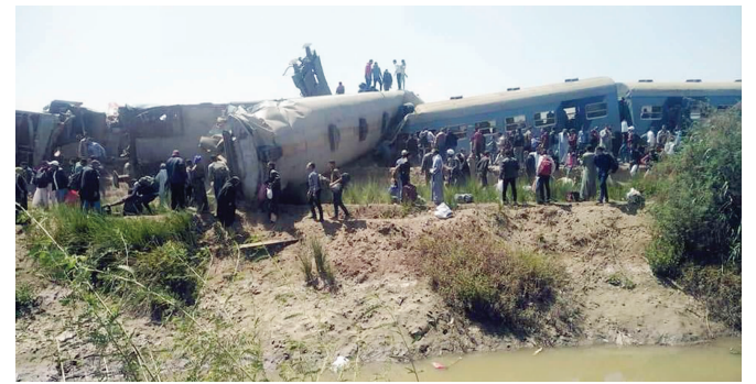
埃及卫生部26日发表声明说,两列客运列车当天在该国南部索哈杰省相撞,造成至少32人死亡、66人受伤。