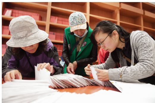
五老村街道树德里社区的居民寻找自己的信封