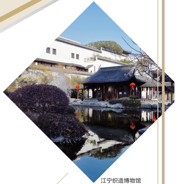
江宁织造博物馆