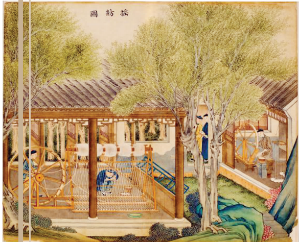
清代 苏州织造局摇纺图