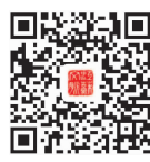
扫码关注 江苏文脉公众号