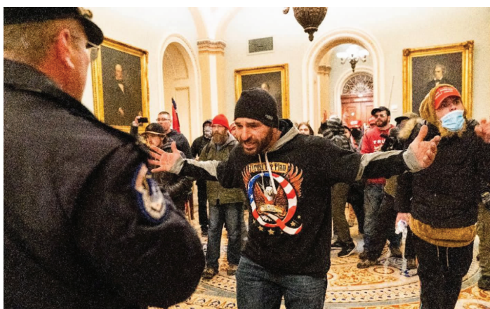
1月6日,示威者在美国华盛顿国会大厦内与警察对峙

店,2020年申请破产,拖欠美国国家税务局超过17.8万美元税款,拖欠西弗吉尼亚州超过22.5万美元税款。他以前的一名生意合伙人说,塔尼奥斯还惹上官司,涉嫌在一次商业投资中侵吞43.5万美元。