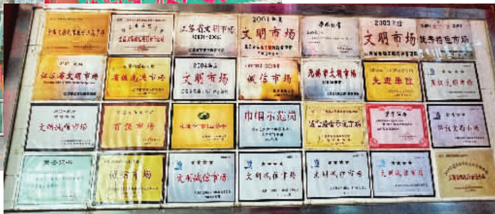
▶市场成立以来获得的荣誉