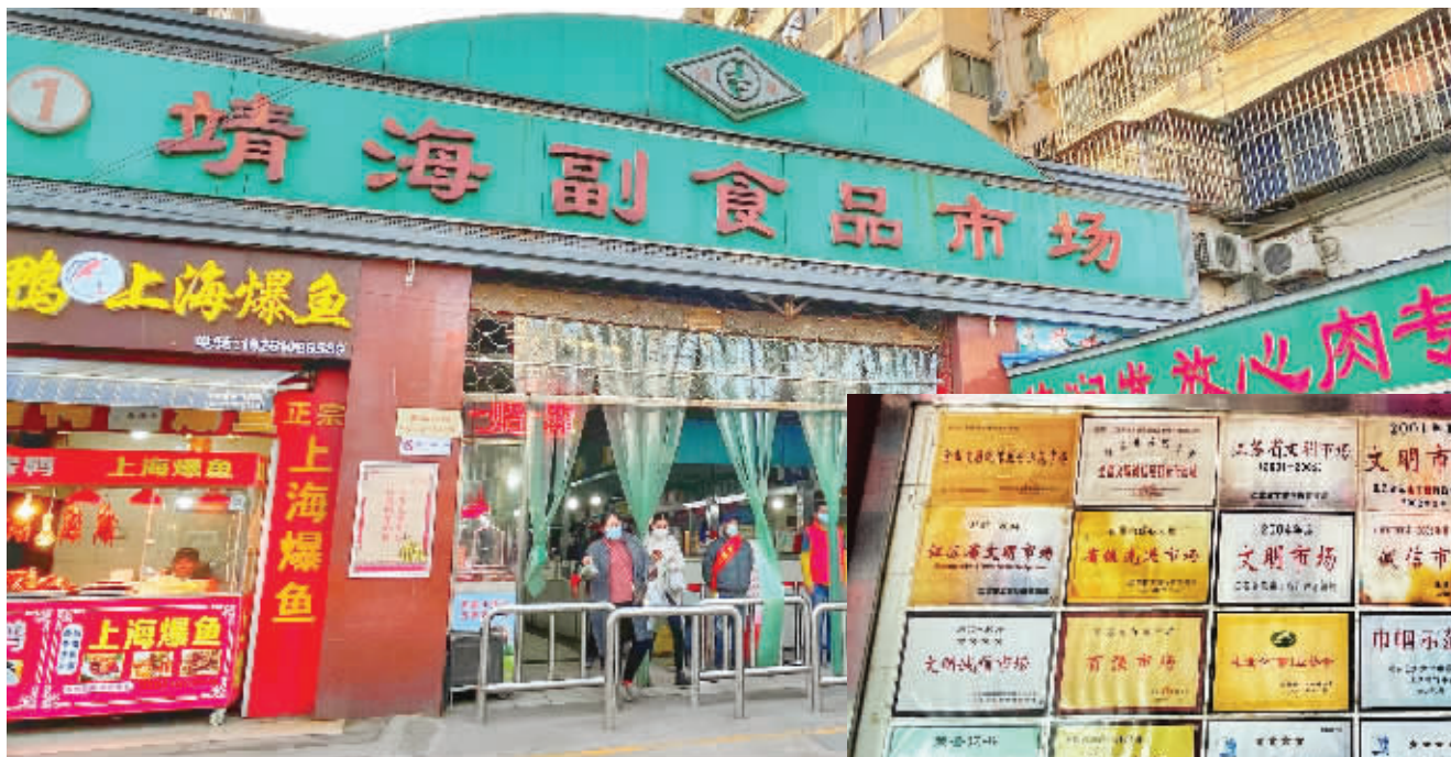
◀靖海副食品市场主入口