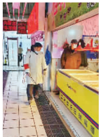
工作人员在市场内进行消毒作业

2021年,靖海副食品市场将在无锡市政府有关部门的统一部署规划下,进一步加快服务型市场建设的脚步,为成为标杆型市场而努力。