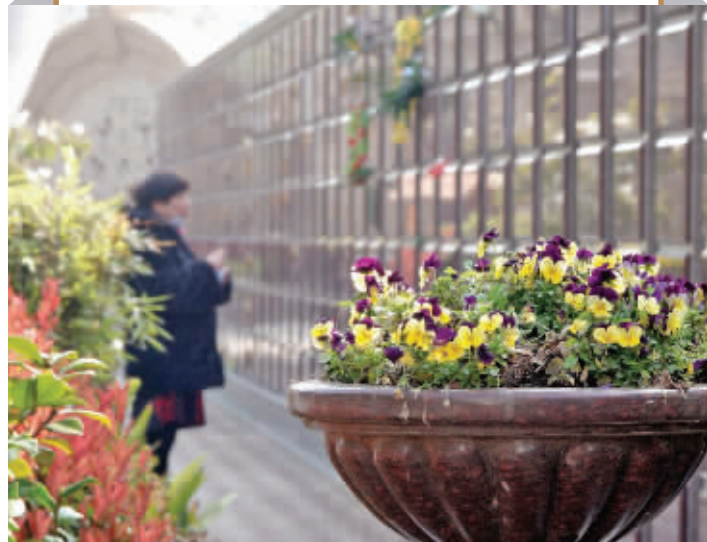
雨花功德园生态葬

在南京市殡葬管理处的全力支持下，从2012年起，功德园正式向全社会推出“雨花功德园，您身边值得信赖的百年生命礼仪服务专家”的全程一条龙品牌服务。连续几年，他们在市殡葬管理处组织的满意度第三方电话回访中，客户的满意度都达到99%以上，位居全市陵园之首。