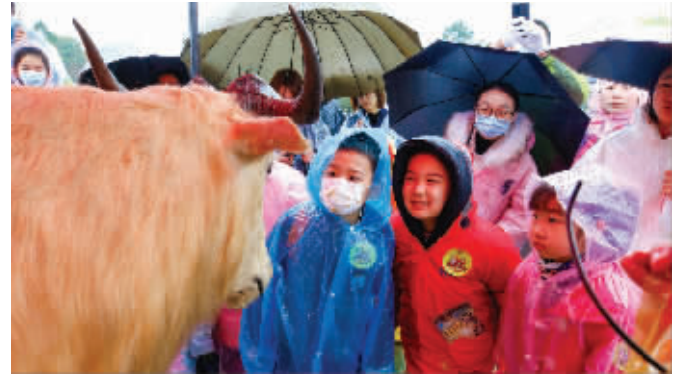
大家观看金毛羚牛标本

“好好的送祝福，怎么变成了要给我们男老师介绍对象了？翻车了，翻车了。哈哈，不过我们好几个男老师都还是单身呢！”对于突然转变的画风，几名男老师也被逗乐了，开始“推销”自己。