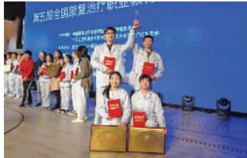
康复技能大赛获奖现场