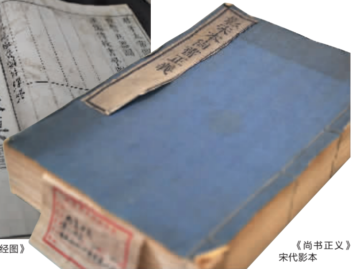
《尚书正义》 宋代影本