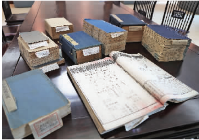
南图馆藏有不同版本《尚书》及相关古籍