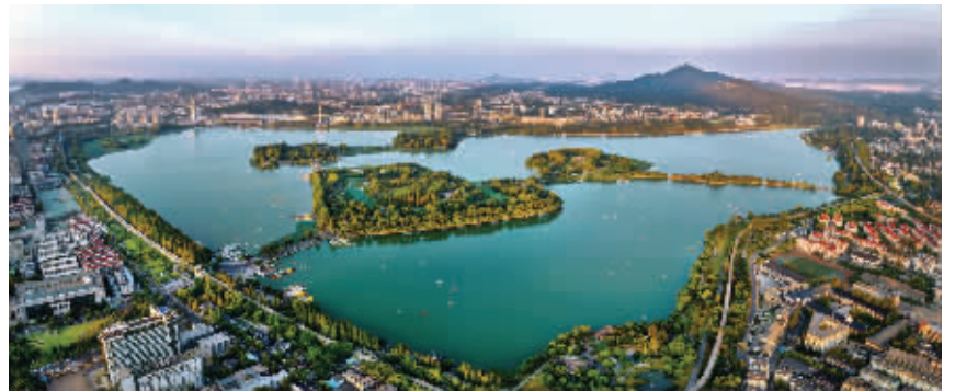
南京玄武湖

2021年是“十四五”开局之年,南京玄武区要怎样做好新一轮的“对标找差”工作呢?3月6日,玄武区委书记阎一峰接受媒体采访时表示,2021年,玄武区将聚焦“创新引领、消费促进”,围绕推进国际消费中心城市中心区建设、常态化疫情防控、产业质效提升年等6个方面发力,向“强富美高”新玄武建设迈出坚实步伐。