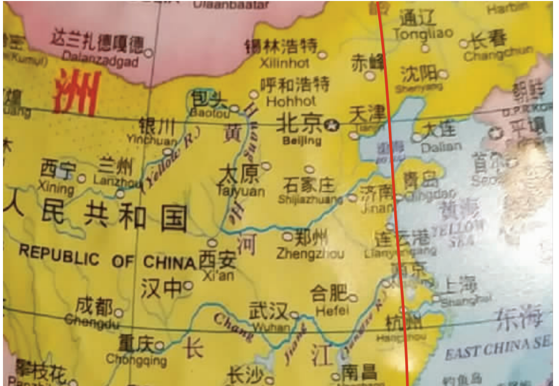
北京时间的基准线是东经120度经线

据迪诺水镇商管公司相关负责人介绍，这个观光塔2009年开建，2014年起对游客开放。观光塔位于该商业街区的核心，高120米，360度旋转上升。登上塔顶，能一览环球恐龙城的全貌以及远眺“东经120大道”。开放6年来，观光塔吸引了约300万人次打卡，时间线上的爱情见证也让观光塔成为常州爱情地标性建筑。