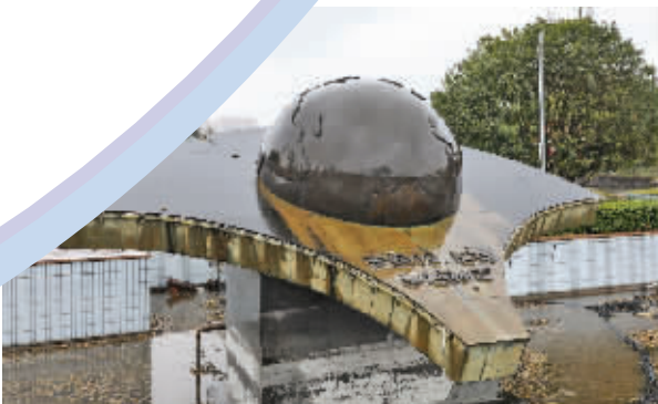
这座东经120度经线穿越标识雕塑，位于泰兴的银杏公园内