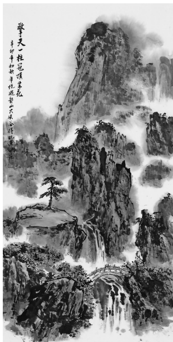
《擎天一柱冠顶生花》137×70cm