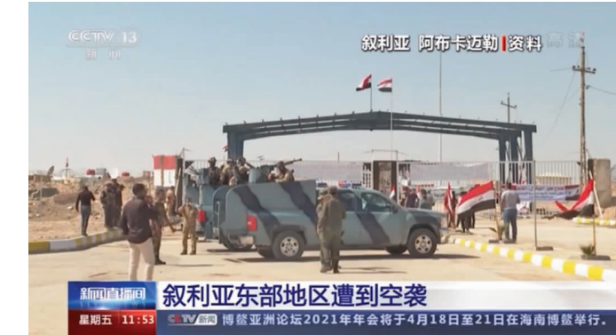
叙利亚阿卜卡迈勒资料图，阿卜卡迈勒是此次美军空袭的主要地区

英国虫害防治协会在全国有700名“虫害捕手”。据协会成员报告，去年春季首次“封城”期间老鼠活动激增51%。去年11月第二次“封城”后，老鼠活动增加78%。