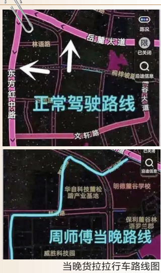
当晚货拉拉行车路线图