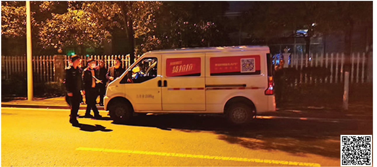
2月22日晚,长沙警方重回案发现场勘查 扫码看视频