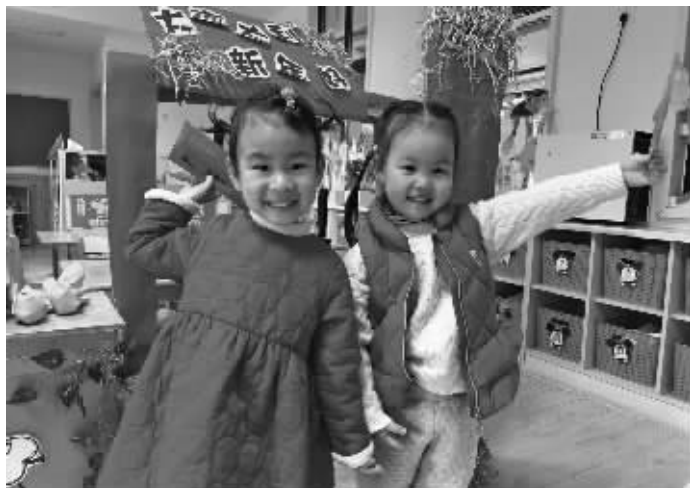
孩子们领到惊喜红包

“咚咚锵,咚咚锵,咚咚锵咚咚锵……”2月22日一大早,在无锡市侨谊幼儿园金科园门口,由大班孩子组建的金科鼓乐队奏响了迎新第一乐章。孩子们手拿鼓槌随着音乐有节奏地演奏着,将新年的快乐和对新学期的美好期盼传递给了来园的每一个小伙伴。还有一些大班孩子则身穿喜庆的唐装,用一句句清脆并充满浓浓情意的“新年好”“新年快乐”等祝福语迎接弟弟妹妹到来,并将需要帮助的弟弟妹妹送到了对应的班级里。