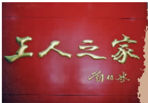
刘伯承题词的“工人之家”