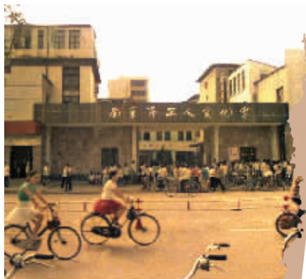
工人文化宫大门