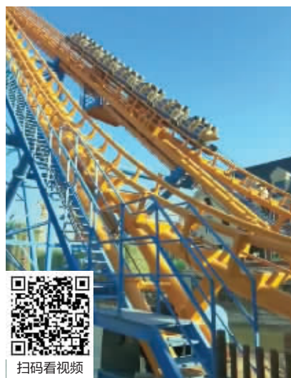
园方手动制停过山车后,游客悬在半空 视频截图 刘卫供图

说,听闻后,景区维保组负责人第一个到达现场,她随后也赶到了。“我们为了大家的安全才手动制停,并不是网上所说的过山车突发故障,而且过山车在轨道的第一节就已经停下,没有安全问题。”周经理表示,事发后,所有游客安全下来,然后有序离开,没有受伤和不适,也没有异议和投诉。