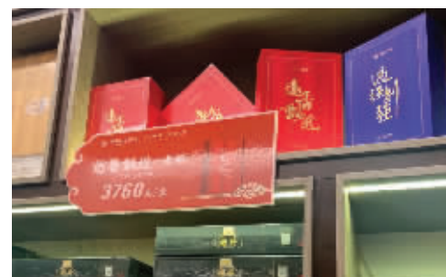
10克装一泡的“远香飘近”岩茶售价3760元