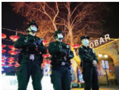
民警在景区执勤

今年是我国疫情防控常态化下的第一个春节。2月18日,现代快报记者从江苏省公安厅了解到,节日期间,全省治安和道路交通秩序良好,接报的警情总量、刑事警情环比分别下降30.25%和30.27%。