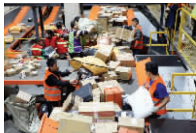
快递人员处理快件

2月18日,现代快报记者从江苏省邮政管理局获悉,2021年春节假期(除夕到初六),全省主要邮政快递企业共处理快件5728万件,是去年同期的3倍。