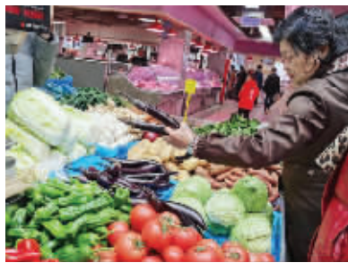
节日市场供应充足