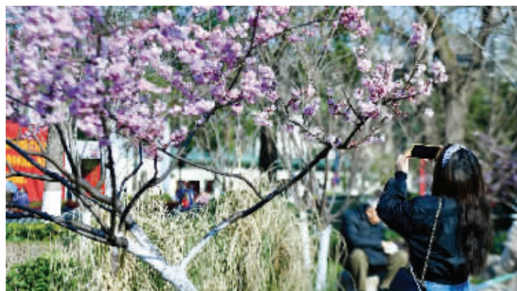
天气晴朗,女孩在南京和平公园拍花