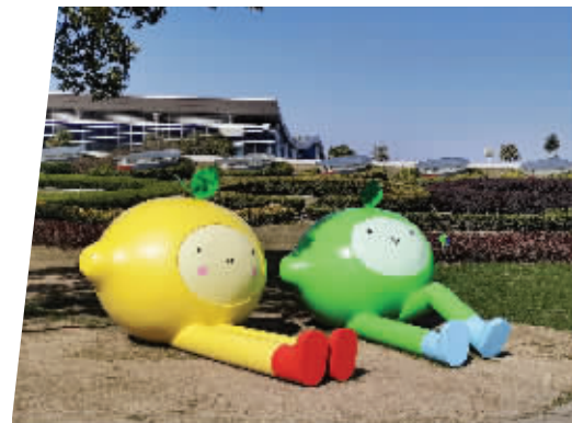
卡通宝宝雕塑