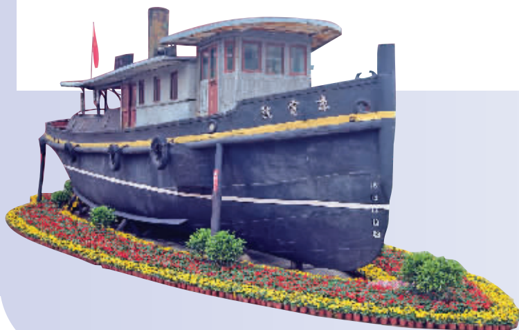
渡江胜利纪念馆(摄于2019年)

新兴文化业态投资方面,首期规模4亿元的市大运河文旅发展基金,将聚焦投资一批数字创意和互联网新兴业态。