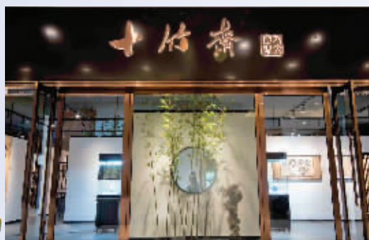
十竹斋人文空间