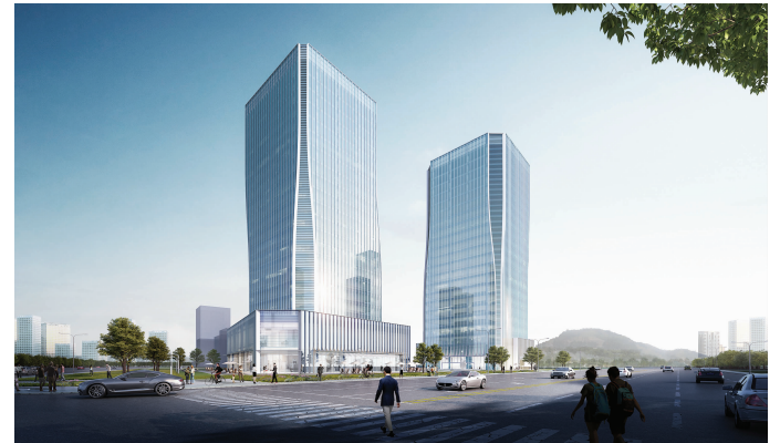
浙大网新人工智能产业园效果图

2月3日,立春。当天上午,南京江北新区、鼓楼区、浦口区、雨花台区等先后举行2021年一季度重大项目集中开工仪式,吹响开工“集结号”!江苏省委常委、南京市委书记张敬华,南京市市长韩立明,南京市人大常委会主任龙翔,南京市政协主席刘以安,南京市委副书记沈文祖等出席相关活动。