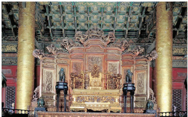
太和殿内宝座 图片来自故宫博物院官网