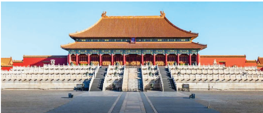
今故宫太和殿(其前身为奉天殿)